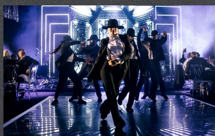
Танцевальное шоу Dance Code – один из самых креативных коллективов страны